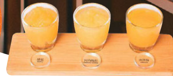
ゼリーの3種食べ比べ(550円)、7種類の中から、好きな3種類を選ぶことができる