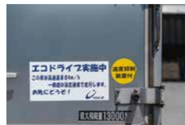
エコドライブの実施 デジタルタコグラフの導入により、環境に配慮した運転を行っています。

当社の全ての事業活動において、環境との調和への貢献を優先的に考え、物流技術の向上を進め、物流環境の改善に取り組み、グリーンロジスティクスの実現を目指して、環境保全活動を推進する。