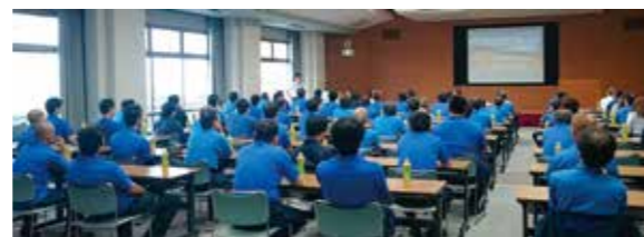
従業員への安全教育、職場安全衛生委員会(各部署 毎月実施)・事故防止懇談会を開催しています。