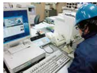
アルコール検知システムを導入し、出発前の検査を徹底しています。