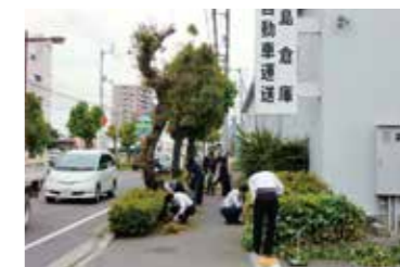
清掃活動の実施 定期的に（ゴールデンウィーク・お盆・年末など）道路清掃を行っています。